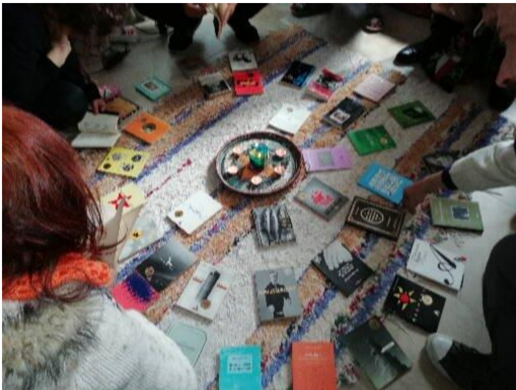
Taller Caminarte Semana Santa del 2018, en Las Casas, Ciudad Real