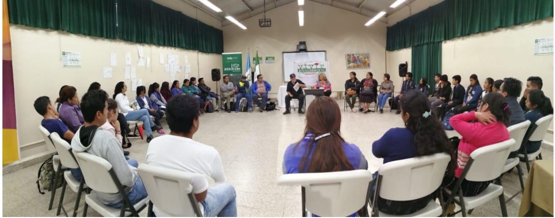
Equipo VIVIR POÉTICAMENTE durante la formación Continua, Universidad del Valle de Guatemala, campus de Sololá.