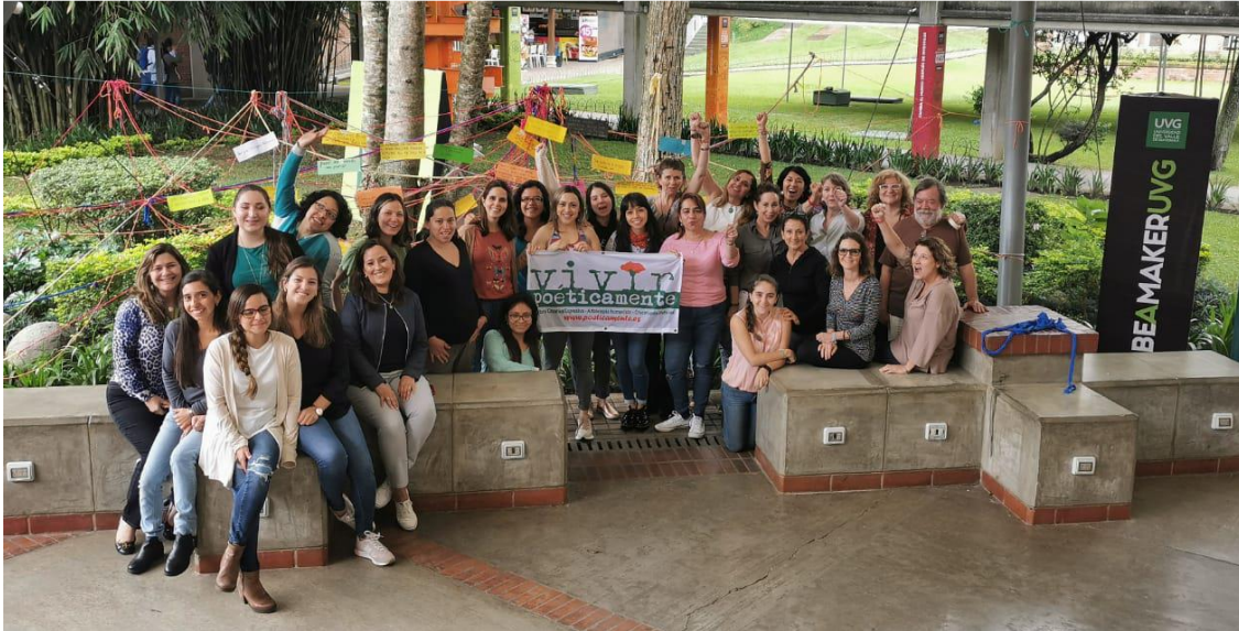
Grupo de la Universidad del Valle de Guatemala. Posgrado en intervenciones con Artes Expresivas

Somos una asociación con un enfoque humanista, solidario que trabajamos a través de la arteterapia, la escritura poética y emocional y las artes expresivas que entendemos la poesía más allá del género literario, como una aspiración a una forma de vivir la vida plena y consciente, desde la contemplación poética y la expresión creativa. Las actividades que ofertamos, tanto las grupales como las individuales, beben de fuentes diversas; la arteterapia gestalt, la escritura expresiva y creativa y la expresión a través de las diversas artes, la bioenergética, la meditación, el mindfulness, la expresión corporal, la animación sociocultural... Están especialmente dirigidas a personas interesadas en la poesía, la literatura, las artes, las terapias alternativas, la educación, la salud, el ámbito social y en general cualquier persona que quiera explorarse y esté motivada en su desarrollo personal.