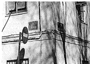
Falta de rotulación