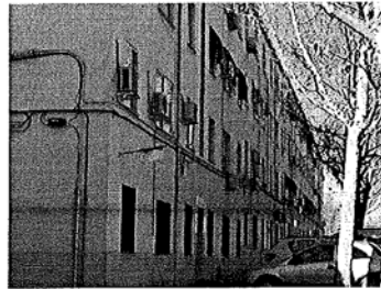
Deteriorada, falta de señalización