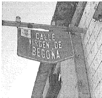
Deteriorada, doblada y sujeta por dos alambres