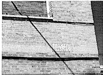
Oxidada y falta de rotulación

Por ello, queremos mostrar sólo algunos de los ejemplos de placas que necesitan ser sustituidas o renovadas.